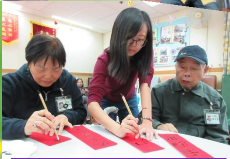
科技大學探訪活動